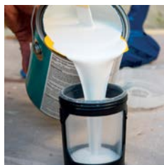
1. FlexLiner™ Sack mit Material befüllen