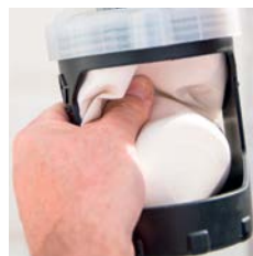
2. Verbleibende Luft herausdrücken